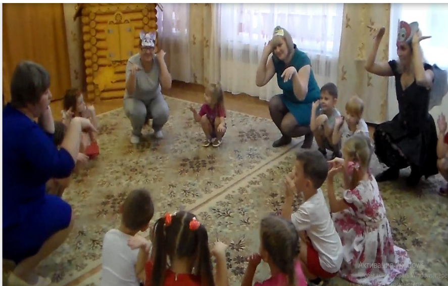
«Праздник подвижных игр»