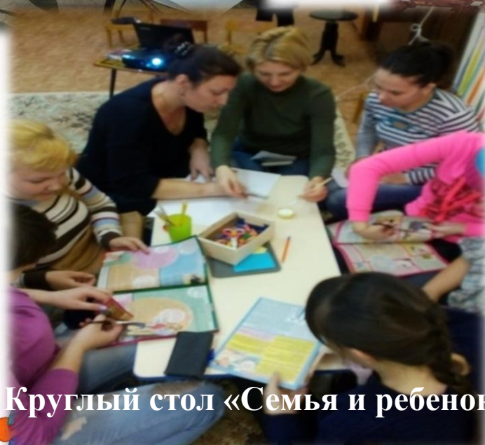
Круглый стол «Семья и ребенок»