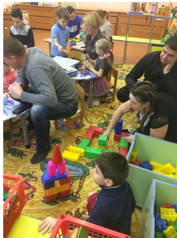
«Корпорация «Конструирующие дети»