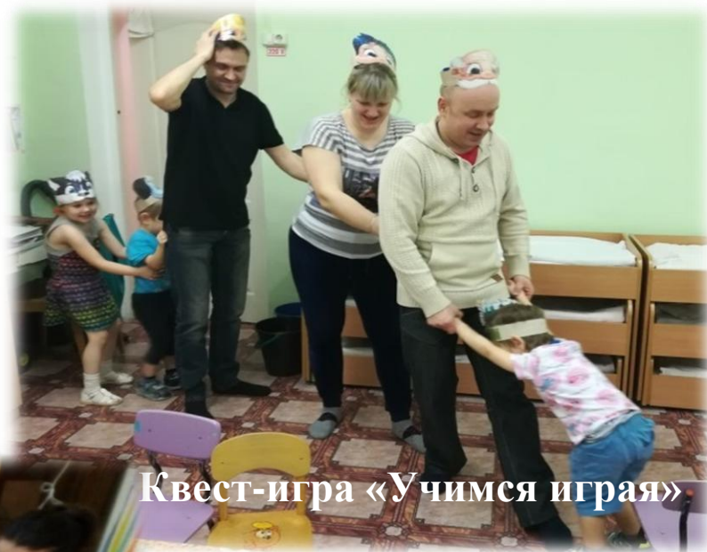
Квест-игра «Учимся играя»